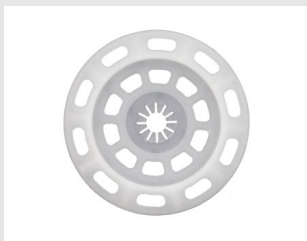
Eurocódigo 057655 ARANDELA DE PLÁSTICO D90 MM PARA ISO / ISOPLUS