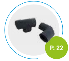
Codos y piezas en forma de T