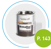
Adhesivo Armafex RS850