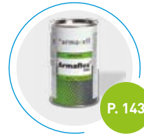
Adhesivo Armafex 520