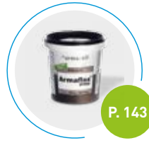
Adhesivo Armafex SF990