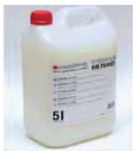
HYDROPANEL RM Primer