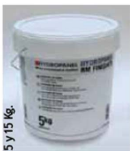
HYDROPANEL RM Finisher

La pasta HYDROPANEL RM Finisher tiene un periodo de caducidad de hasta 2 años en bote, siempre que se almacene en lugar adecuado, seco, al abrigo de heladas o altas temperaturas.