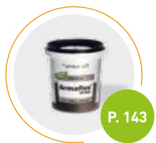
Adhesivo Armaflex SF990