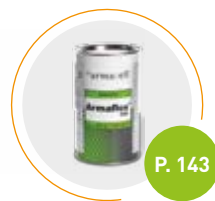
Adhesivo Armaflex 520