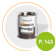
Adhesivo Armaflex RS850