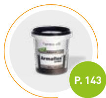
Adhesivo Armaflex HT625