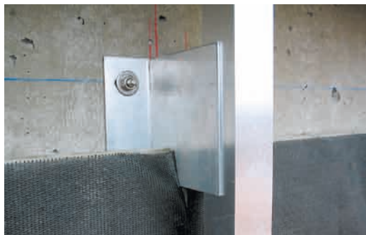
Inco 10 Negro (fijaciones Ecovent)

Para cerramiento base de hormigón o de ladrillo perforado con un revoco de mortero de al menos 1 cm de espesor, fijaciones tipo HILTI X-IE 6-60 DI52, o similar.